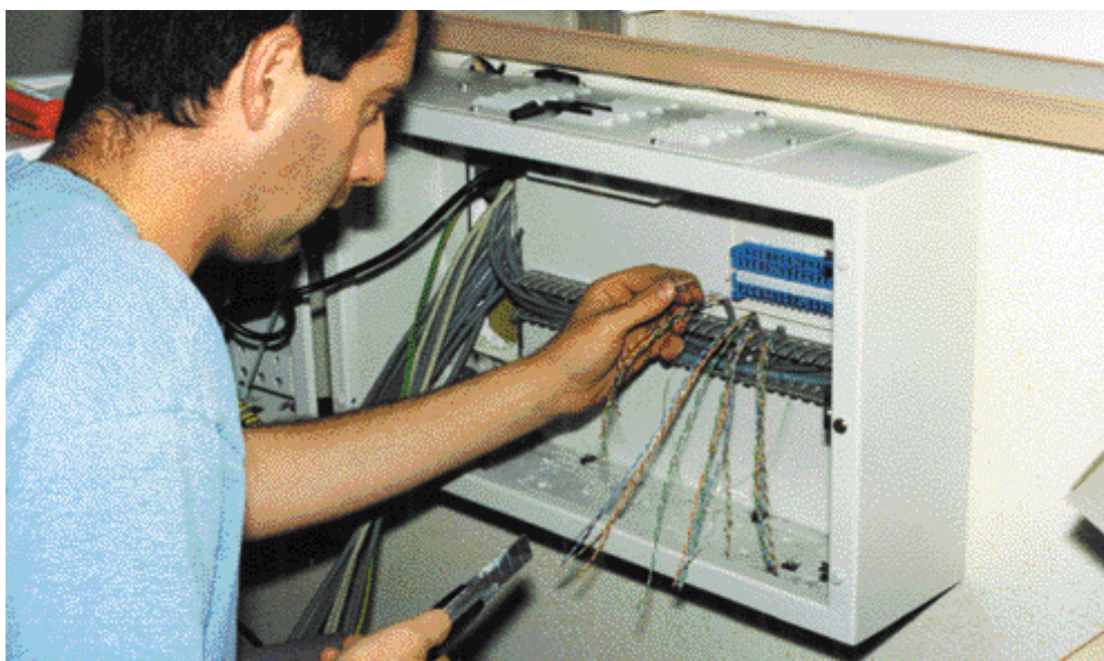
Habilité. Tout lycée professionnel peut percevoir la taxe d'apprentissage.

Afin de rendre plus efficiente et plus transparente la collecte de la taxe d'apprentissage, l'État a modifié le régime juridique de celle-ci par la loi de modernisation sociale du 17 janvier 2002. Une circulaire de la DGEFP 1 détaille, à présent, la nouvelle organisation de la collecte de la taxe d'apprentissage ainsi que ses modalités de gestion et de répartition. Pour préciser les termes de cette modification et en mesurer les conséquences pour les établissements d'enseignement, nous avons interrogé les responsables d'ASP (Au service de la profession).