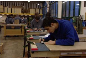
Bois & matériaux associés